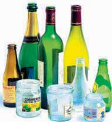
Verre seulement, sans couvercle ni bouchon. Pas de vaisselle, pas d'ampoule...

Déposez le verre dans le conteneur le plus proche :