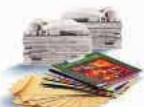
Journaux, magazines, papier

Déposez le verre dans le conteneur le plus proche :