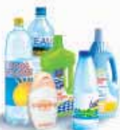
Bouteilles et flacons plastiques

En vrac, dans le bac vert, déposez uniquement :