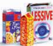
Cartons et cartonnets